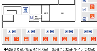
◆居室30室/総面積:14.75㎡ (居住:12.32㎡・トイレ:2.43㎡)