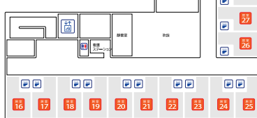
◆居室30室/総面積:14.75㎡ (居住:12.32㎡・トイレ:2.43㎡)