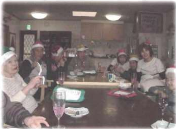
シャンマイでメリークリスマス!