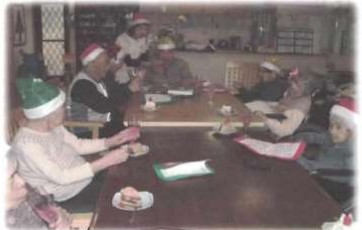
ケーキのおいしかね〜。