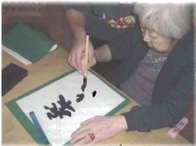
軽く手を添えて、久しぶりに書いたよ