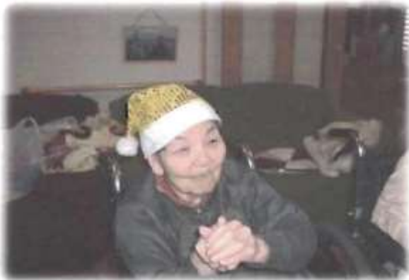
素敵なお笑顔ですね