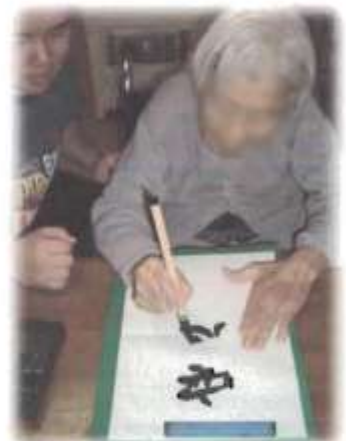
書きまらやうか〜。と言われながらもとてもすばらしい書き初めが出来ました。