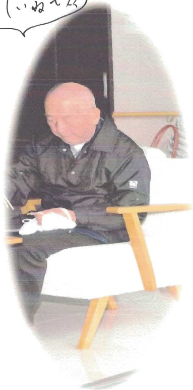
会場のデッキの方で食事して頂きました。