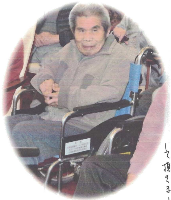
会場のホールに移動してお食事して頂きました。