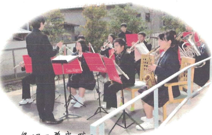
島栖工業高校の吹奏楽部の生徒さん連に来て頂きました。